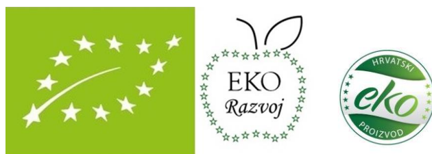
HR-EKO-10 EU poljoprivreda

Kodni broj kontrolnog tijela za Organske Proizvode koji su proizvedeni u Hrvatskoj je HR-EKO-000 pri čemu se zadnja tri broja odnose na redni broj Agencije koja je ovlaštena za certifikaciju eko proizvodnje (primjer na slici dolje lijevo). Hrvatski eko logo je moguće koristiti samo zajedno uz Europski, u suprotnom on nema valjanost.